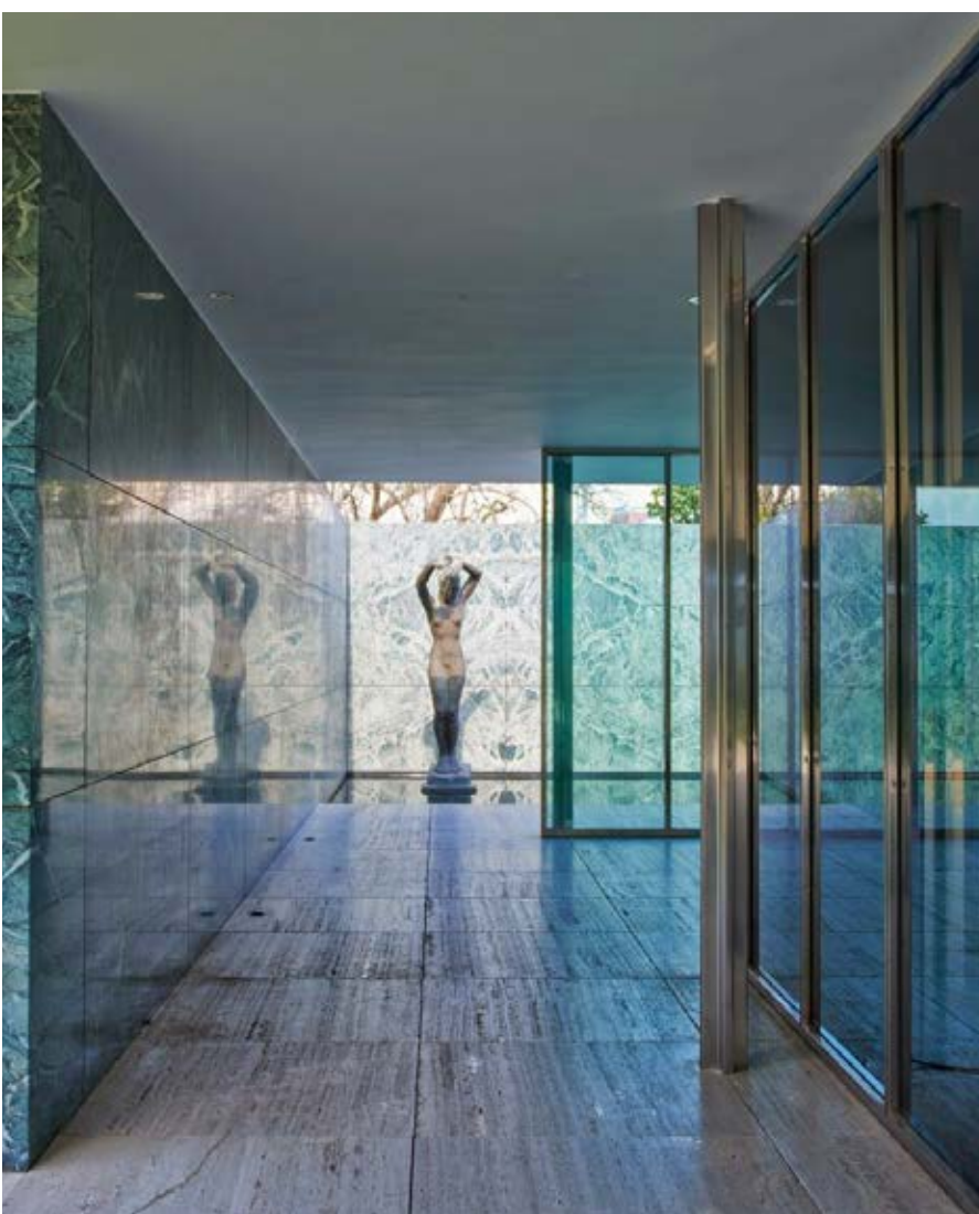
Pabellón Mies van der Rohe Barcelona