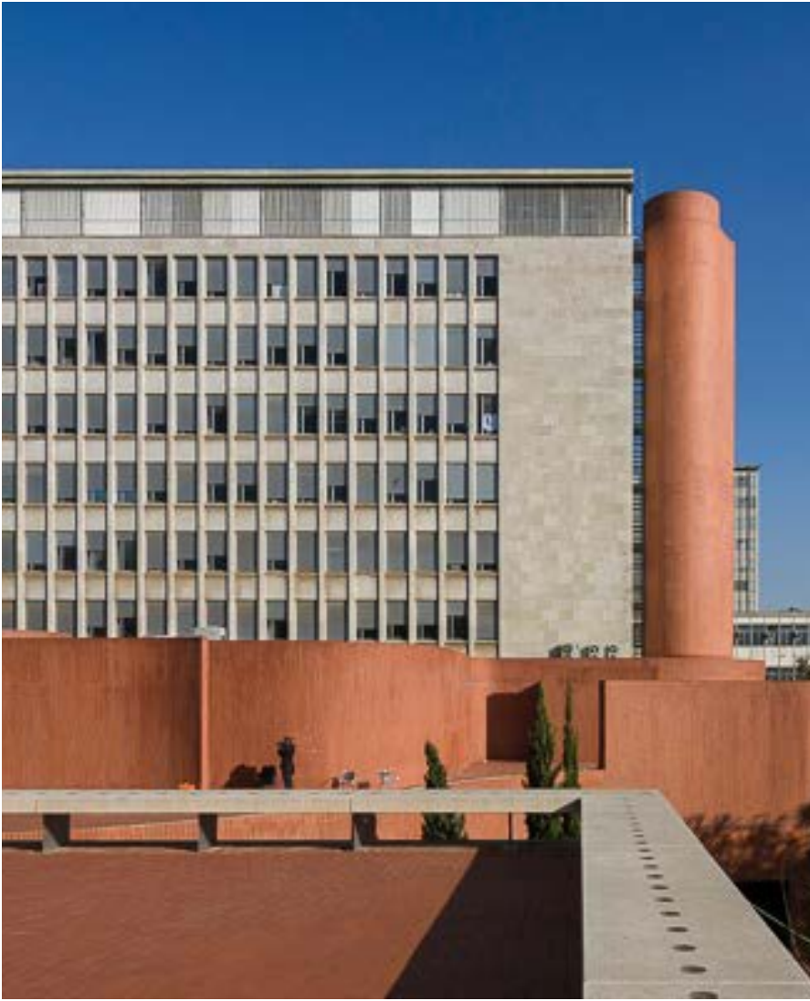
Escuela Técnica Superior de Arquitectura en Barcelona